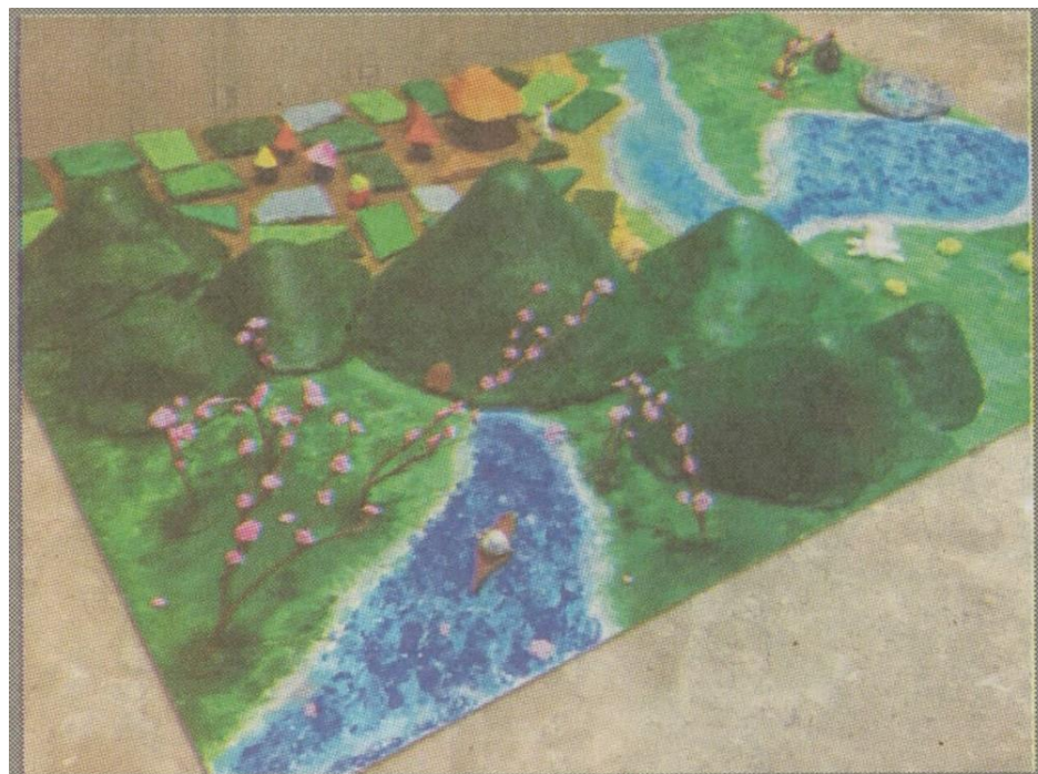
高一學生用模型重現陶淵明的桃花源記。